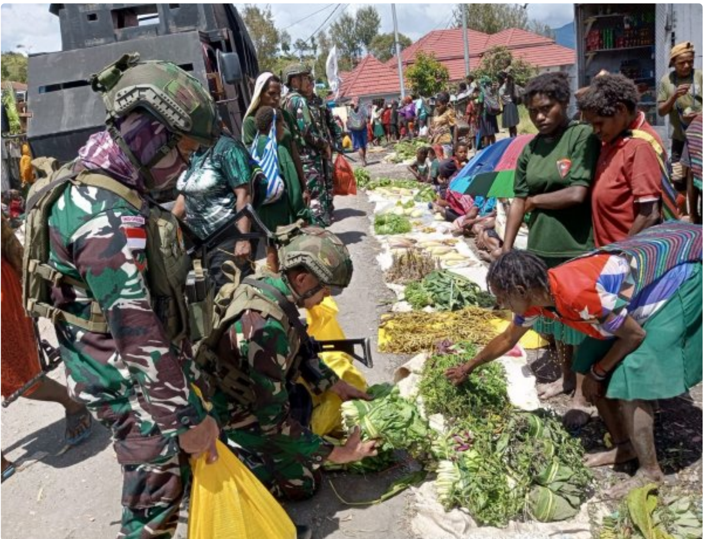
INTAN JAYA- Satgas Yonif 509 Kostrad Pos Langit Bilogai kembali